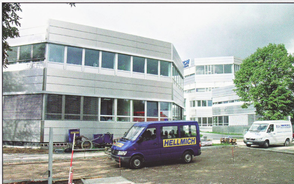
Glaspalast, Dinslaken Um- und Ausbau Sitz der Stadtverwaltung Bauvolumen: ca. 6 Mio. Euro