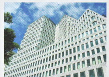
Concorde Hotel Berlin

Neubau eines 5-Sterne Hotels der absoluten Spitzenklasse im Zentrum Berlins