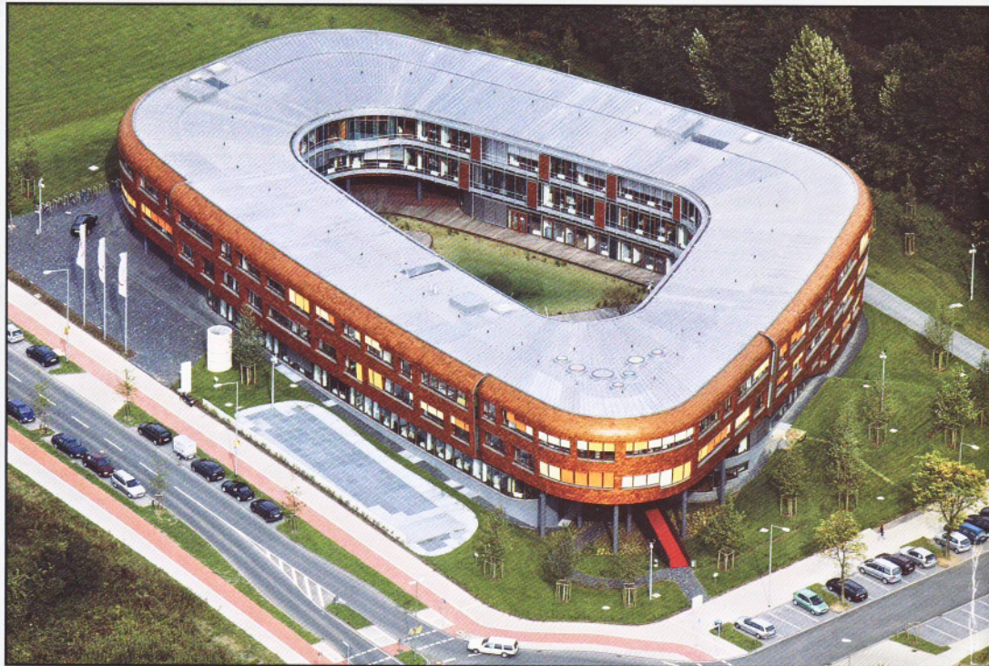
Infineon Development Center