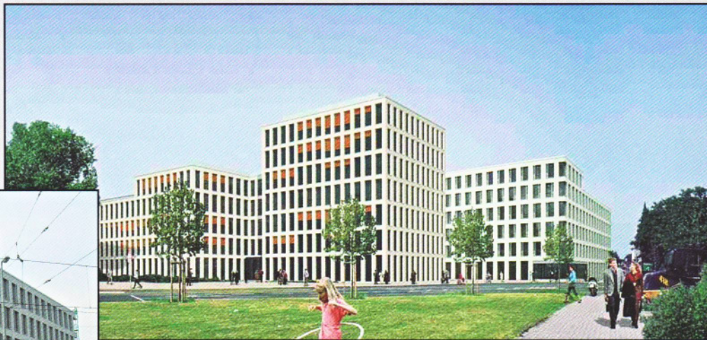
Medical Center Ruhrort (2. Bauabschnitt) Medizin- und Geschäftszentrum in Duisburg Ruhrort Bauvolumen: ca. 13 Mio. Euro