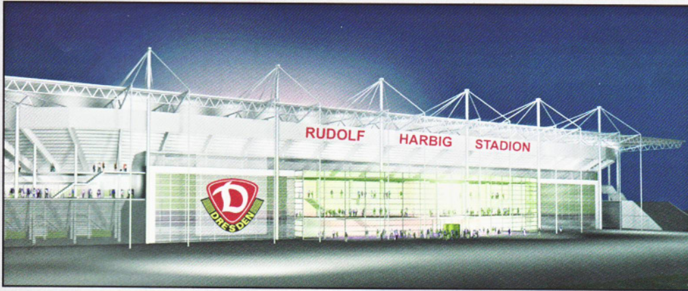
Rudolf-Harbig-Stadion, Dresden Bauvolumen: ca. 47 Mio. Euro Wettbewerbs-Entwurf