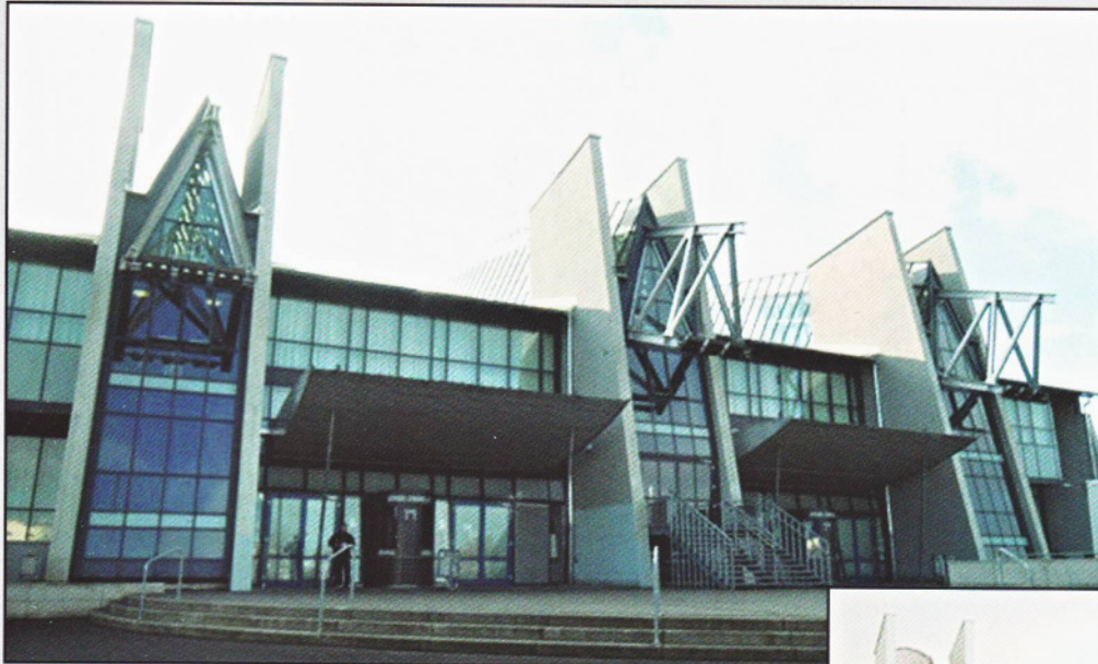
Bördelandhalle, Magdeburg Umbau zu einem multifunktionalen Event- und Business Center Bauvolumen: ca. 15 Mio. Euro