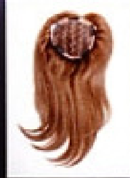
13x15 cm; L=35 cm