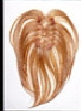
14x8 cm; L=30 cm; Futura Fiber